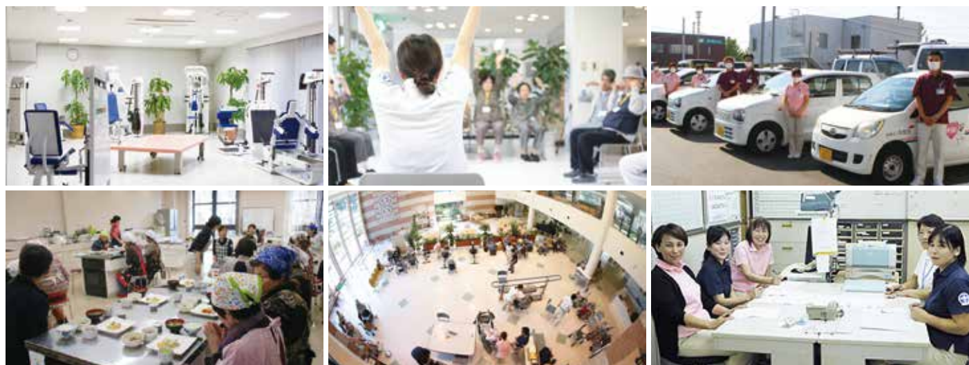
(左上から) デイケアのリハビリルームと『ゆうあいフィットネス』で開催される介護予防フィットネスの様子。訪問看護ステーション、24時間定期巡回随時対応型サービス、訪問診療は病院MBCと協力して進められている。(左下から) 生活習慣病の予防・改善に継続的に取り組むことを目標として健診事業を行う「健康管理センター」が行う糖尿病料理教室の様子。介護老人保健施設「ケアコートゆうあい」のホール。(右下) ヘルパーステーションゆうあいのスタッフルーム。