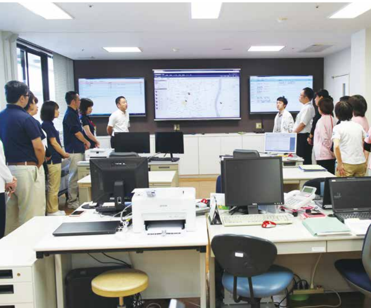
病院と在宅をシームレスにつなぎ、高齢の患者が安心して地域で暮らし続けることを支援するMBC(Medical Base Camp)