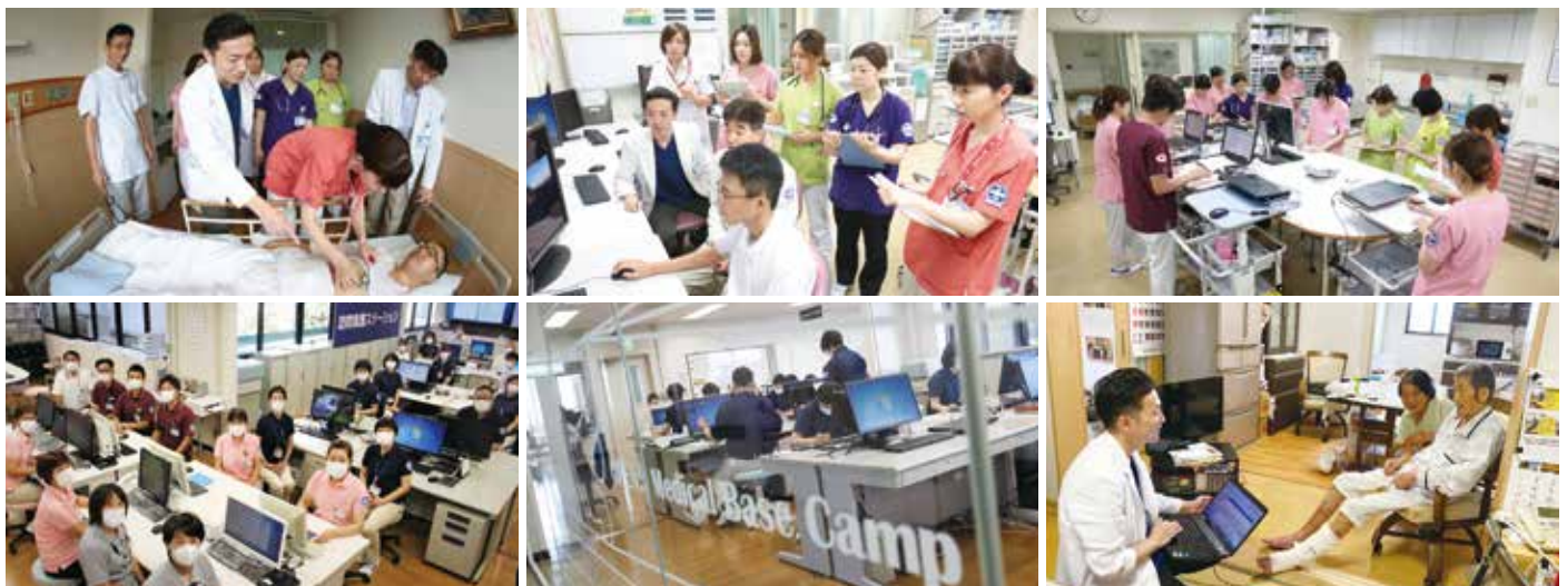
（左上から）治療と並行して、多職種協働フラット型チームで在宅医療に向けての支援を進めている。（左下から）多職種で、MBC（メディカル・ベース・キャンプ）による退院直後の在宅医療支援の強化、ケアの継続を図っている。（右下）訪問診療の様子。電子カルテのクラウド化により在宅でも電子カルテの活用が可能。

MBCは、2015年、織田病院の2階にある「連携センター」内に設置された、退院直後の在宅医療支援を行うチームである。MBCチームは医師、訪問看護師、理学療法士、メディカルソーシャルワーカー、ケアマネジャー、ヘルパーの多職種約30名で構成され、患者の退院と同時に在宅医療の支援を開始する。これにより、退院直後2週間の在宅療養生活